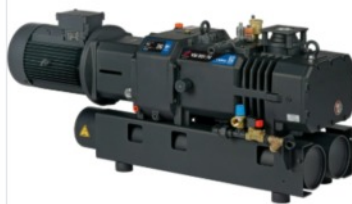
Pompe per vuoto a vite secca

Serie C - Vuoto e aria compressa a secco e senza contatto per applicazioni industriali