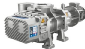
Pompa per vuoto a lobi rotanti R-VWP

Serie L - Progettata per processi umidi, offre affidabilità e durata senza pari per diverse applicazioni industriali.