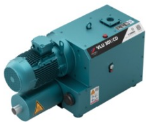
Pompe per vuoto a secco a artiglio e compressori

RIMA è partner ELMO Rietschle e oltre alla fornitura di nuovi sistemi offriamo assistenza per la manutenzione ordinaria e straordinaria con parti originali e la competenza dei nostri tecnici.