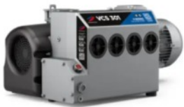
Pompe per vuoto e compressori a palette rotative

G-Serie - Soluzioni affidabili ed efficienti per vuoto e compressione per applicazioni industriali.