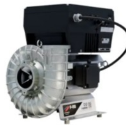
Radial Compressors, Fans & Vacuum Pumps

S-Serie - Soluzioni per vuoto senza olio e senza contatto, progettate per precisione e prestazioni industriali.