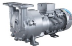
Pompe per Vuoto ad Anello Liquido e Compressori

Serie V - Pompe a palette rotative, sia a secco che lubrificate a olio, leader nel settore, progettate per applicazioni industriali di vuoto e compressione.