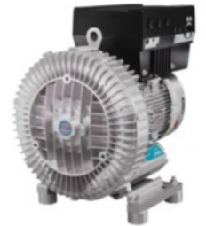
Soffianti a Canale Laterale

Radial fans are mainly used in the packaging and paper industries, with the smaller units used for extracting dust with fine material such as paper powder